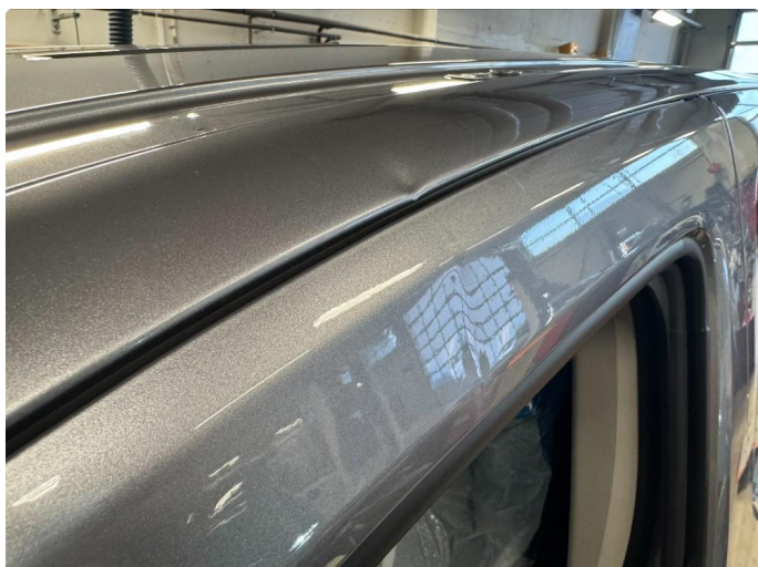
1.2 Noen skader førerdør.