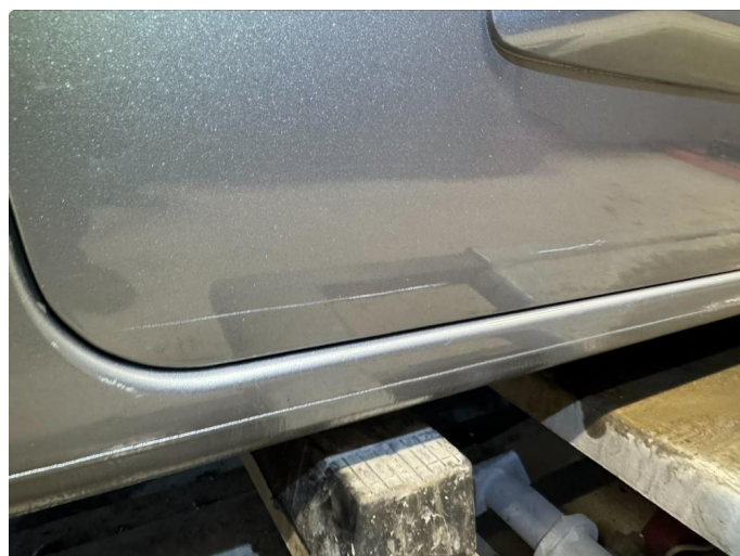
1.3 Bulk med ripe høyre skyvedør.