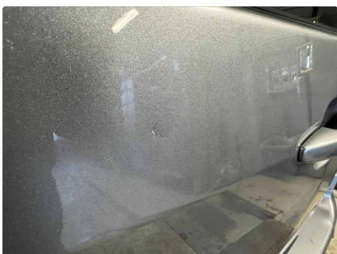
1.4 Små lakkskader begge bakdører