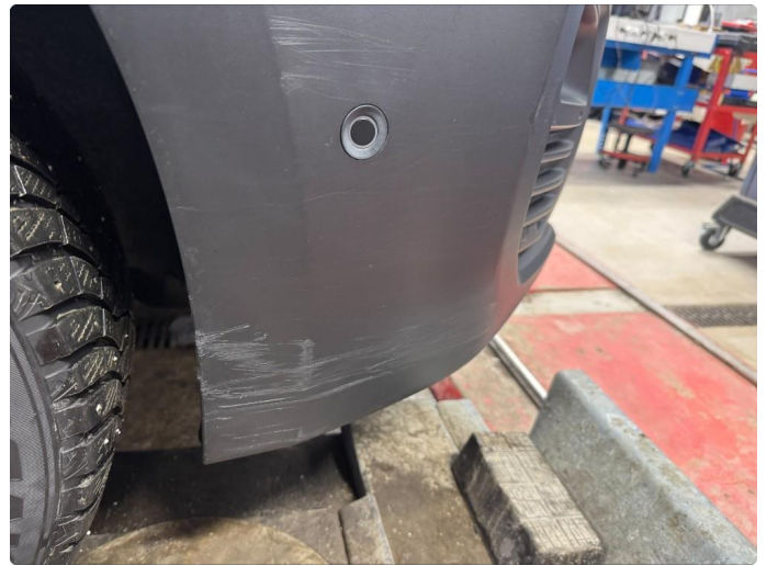
1.7 Riper frontfanger høyre side