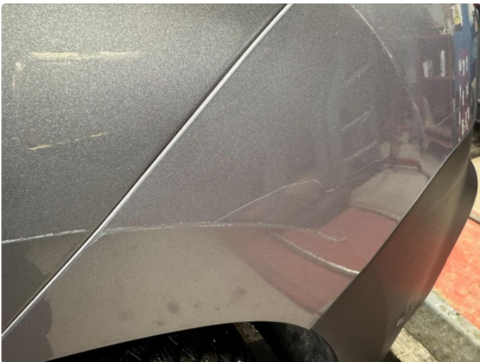
1.7 Riper frontfanger høyre side