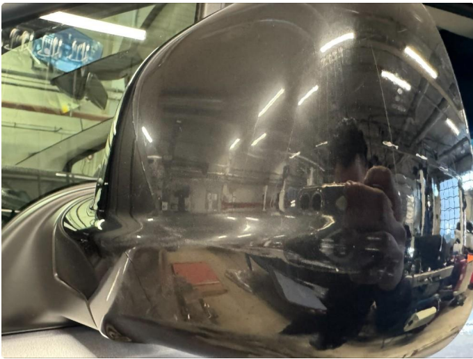
1.6 Riper på speilhus begge sider