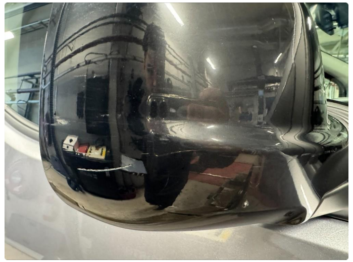
1.6 Riper på speilhus begge sider