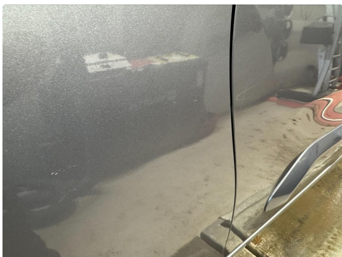
1.3 Bulk med ripe høyre skyvedør.