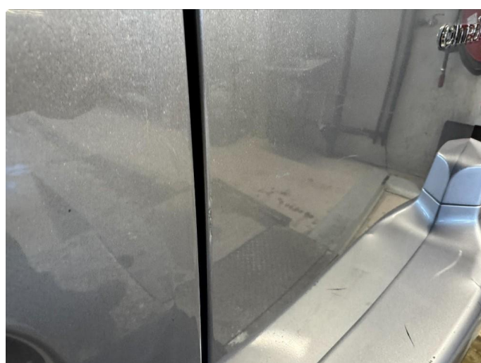
1.4 Små lakkskader begge bakdører