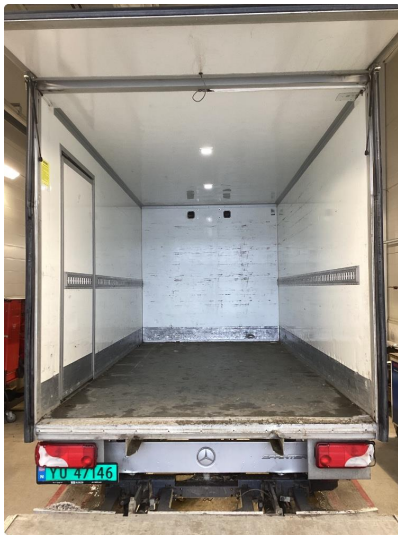
4.1 Knust komplett høyre baklys.