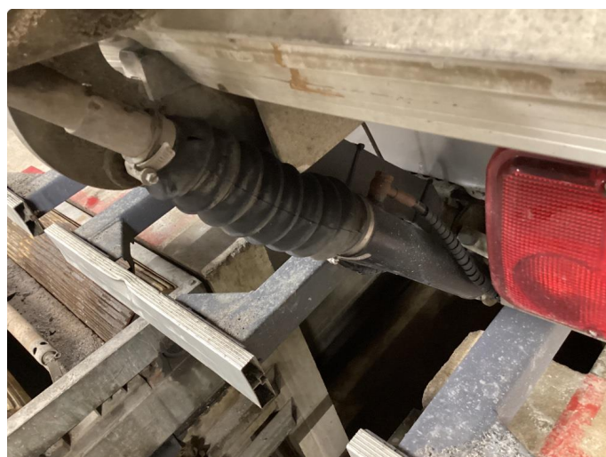
3.10 Skade på begge mansjetter tilt sylinder.