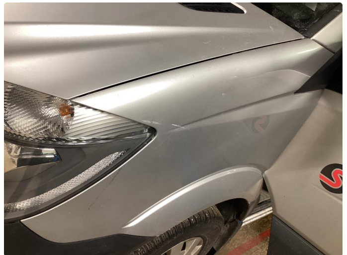
3.19 Lakkskader venstre side foran.