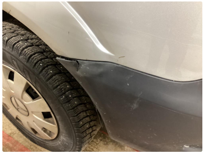
3.15 Skade på støtfanger høyre side foran.