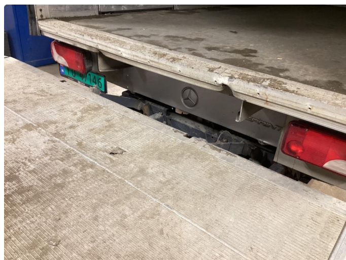
3.9 Hull i løfte bord. Skade på bunnlist. Mangler gummipakning nede.