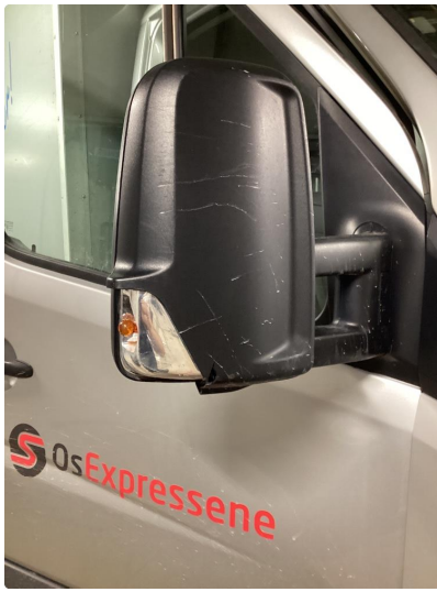
3.13 Knust speilhus høyre side med blinkelys.