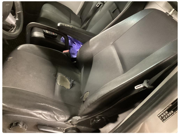
8.1 Setepute sete rygg Og midtarmlene meget slitt.