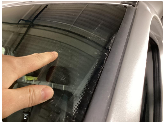
3.17 Steinsprut med sprekk utenfor synsfelt