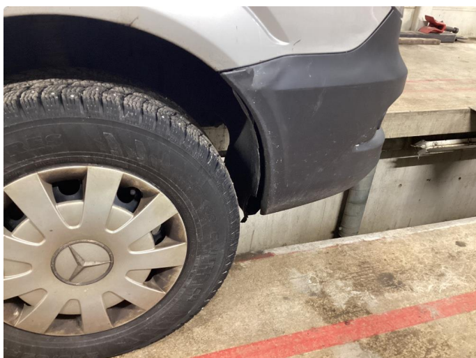
3.7 Innerskjerm høyre side foran skadet.