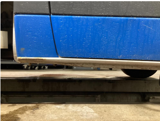
3.18 Bulk og rust i kanal høyre side.