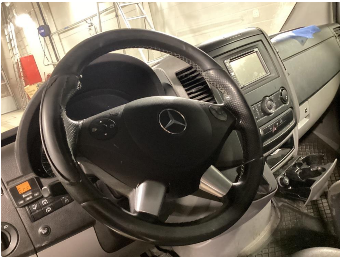
8.5 Slitt ratt trekk.