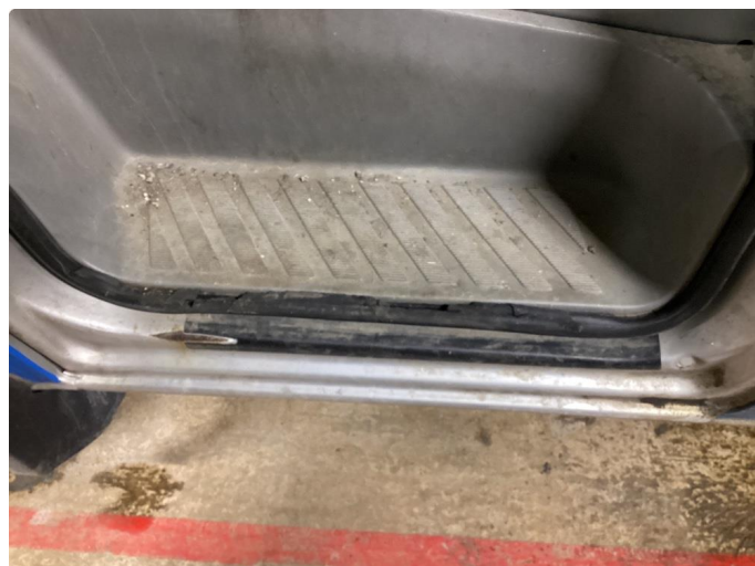
3.3 Defekt dør pakning venstre side.