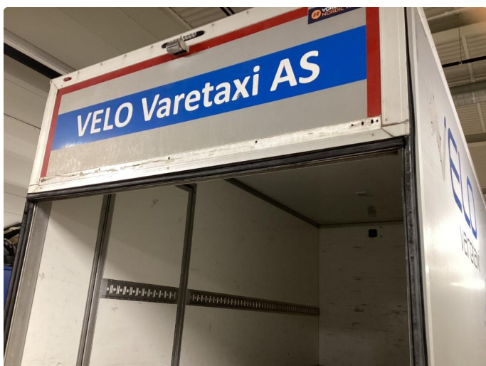
3.9 Hull i løfte bord. Skade på bunnlist. Mangler gummipakning nede.