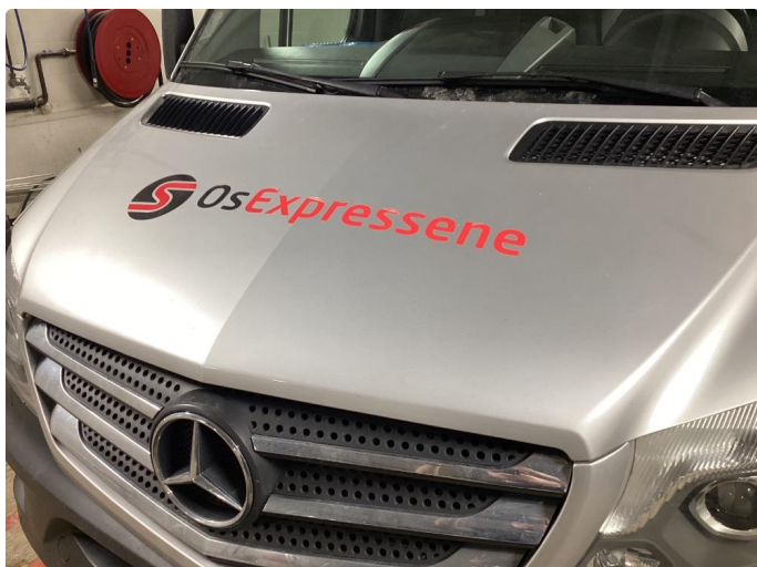
3.1 En del små steinsprut med rust på panser.