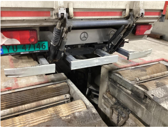
3.16 Underkjørings hinder bak har flere skader.