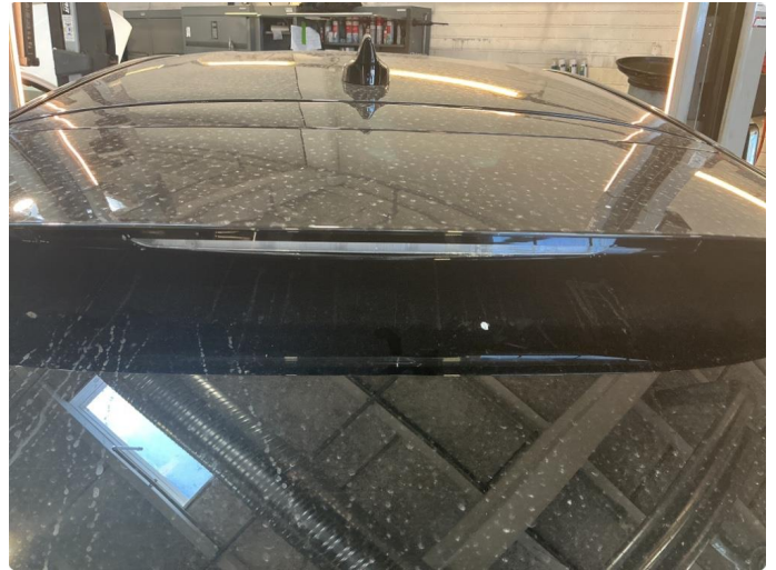
2.1 Defekt / sprukket glass