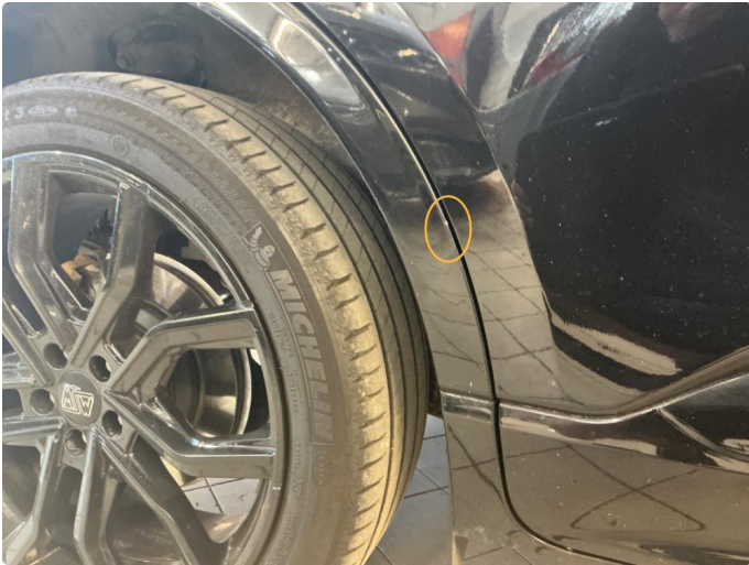
1.1 Noe steinsprut