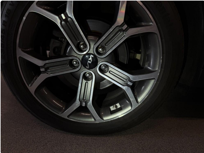
1.1 Kantkjørt felg - 1 stk. sommerhjul.