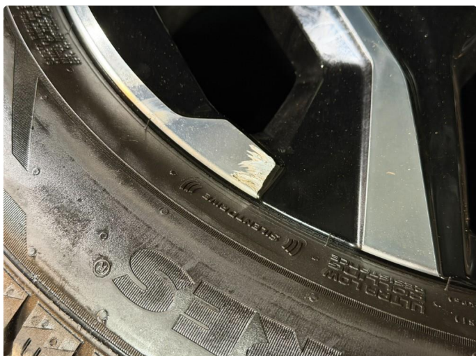
1.1 Kantkjørt felg - 2 stk. vinterhjul.