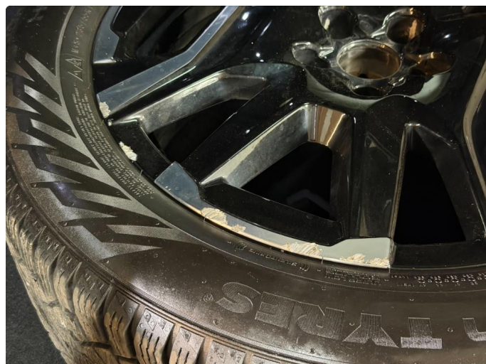
1.1 Kantkjørt felg - 2 stk. vinterhjul.