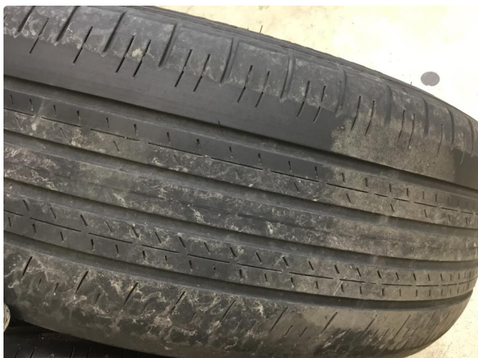
1.1 For liten mønsterdybde sommerdekk