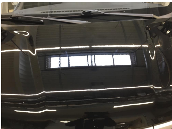
1.1 Mye stensprut