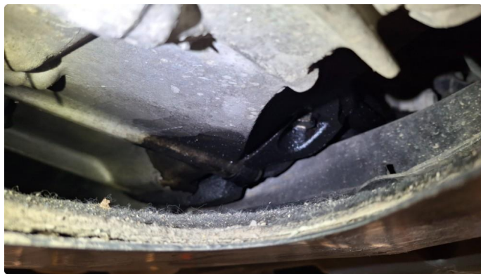
3.1 Oljelekkasje fra motor