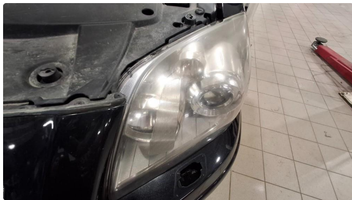
2.2 Matte glass