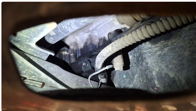
3.1 Oljelekkasje fra motor