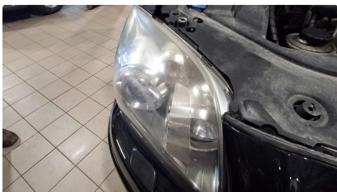
2.2 Matte glass