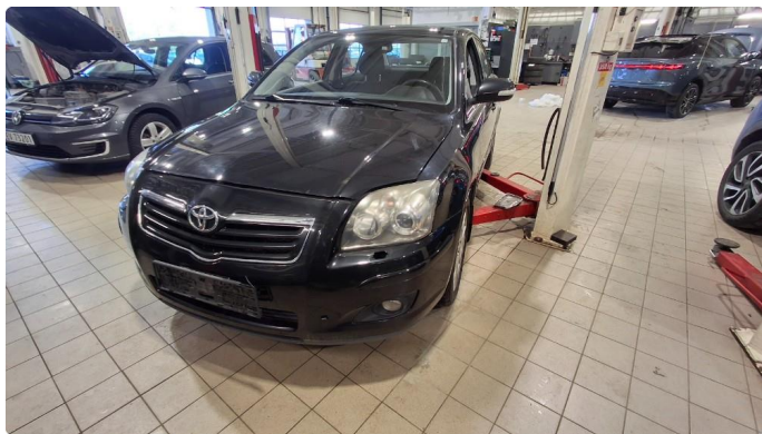
2.1 Nærlys lyser ikke