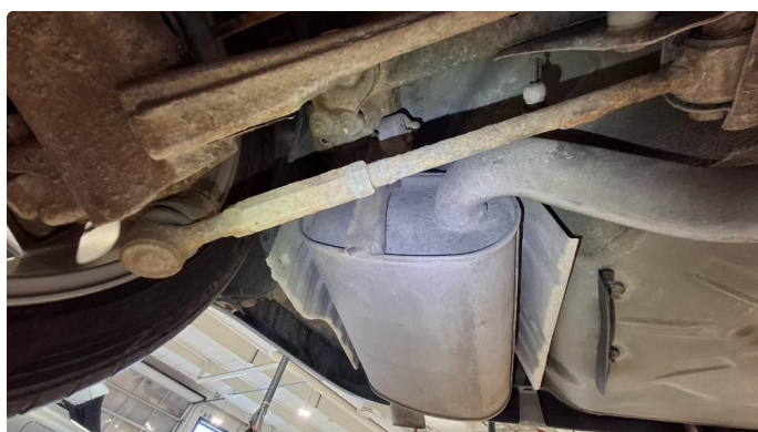
1.2 Løst varmeskjold