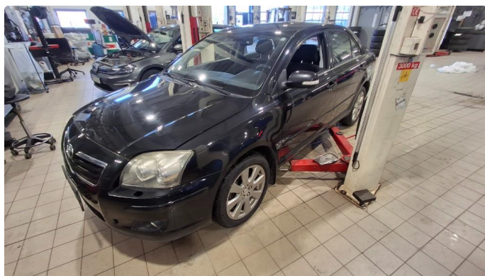
1.4 Lyktespyler virker ikke