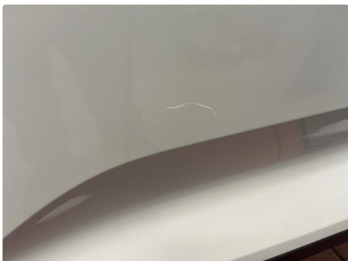
1.2 Liten ripe nedre del av dør