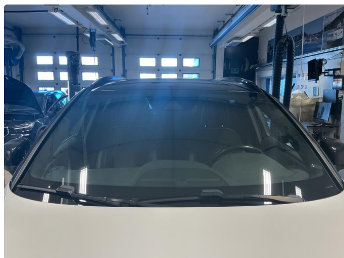
1.3 Små steinsprut i henhold til alder og kilometer