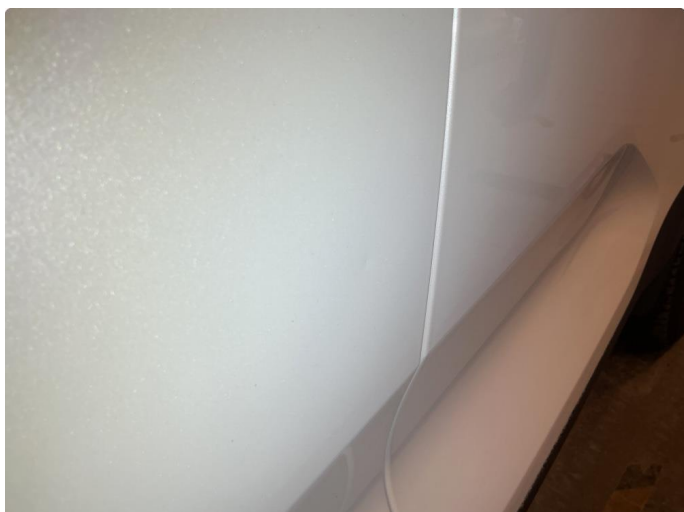
1.1 Liten parkeringsbulk på dør