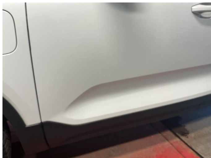
1.2 Liten ripe nedre del av dør