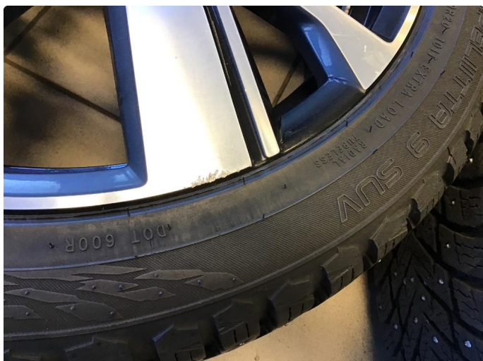
1.1 Liten kantkjøring