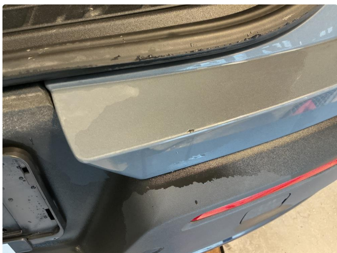
1.2 Ripe/lakk (halv del)