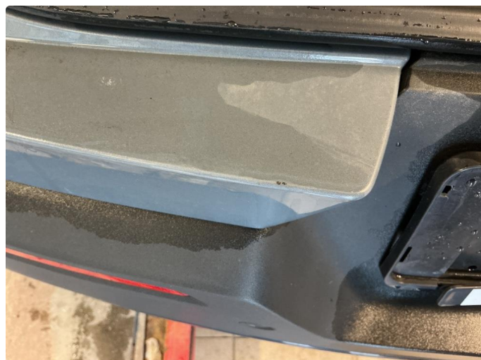
1.2 Ripe/lakk (halv del)