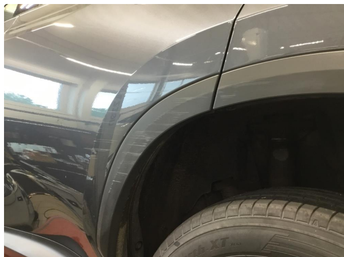
1.2 Plastinnerskjerm skadet