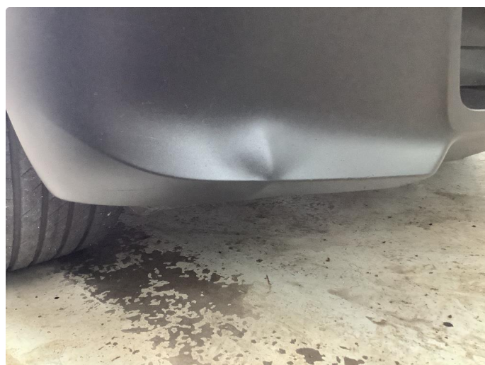
1.4 Spoilerlist defekt