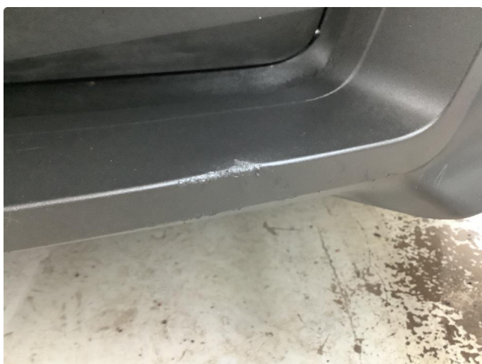
1.4 Spoilerlist defekt