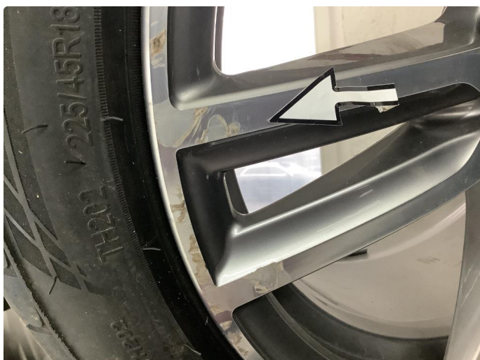
1.2 Kast i felg