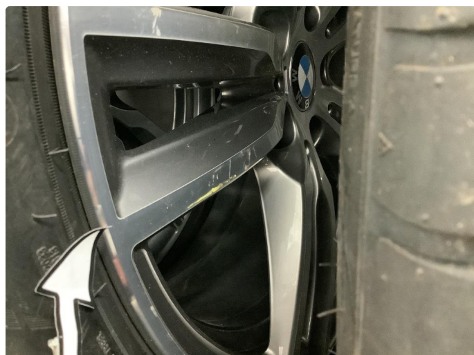
1.2 Kast i felg