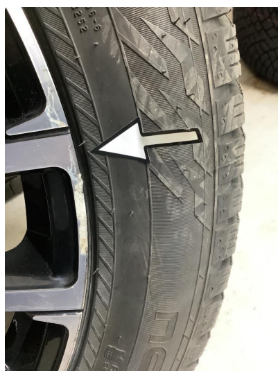
1.3 Kantkjørt felg Diamond Cut