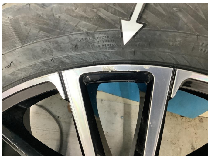
1.4 Kantkjørt felg Diamond Cut