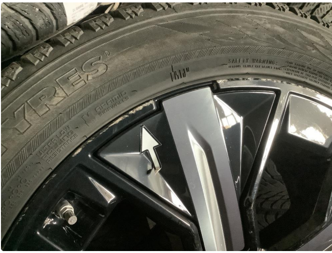
1.6 Kantkjørt felg