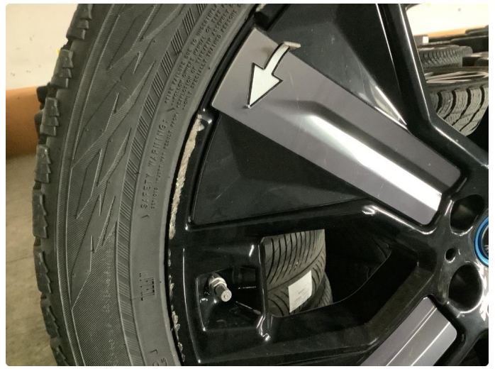
1.6 Kantkjørt felg