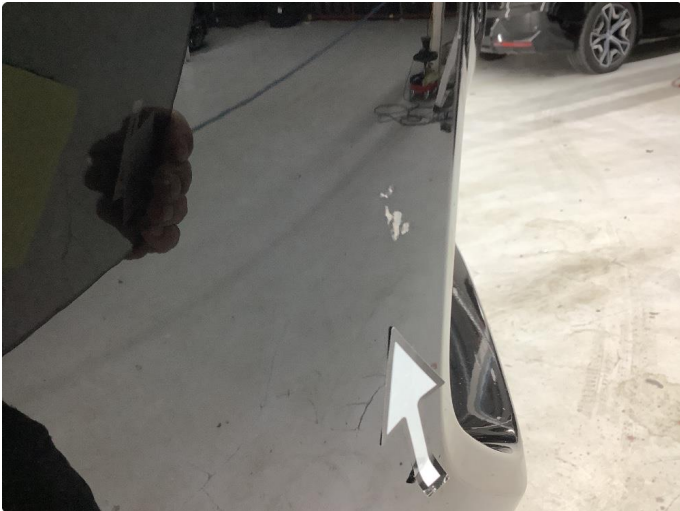
1.1 Ripe/lakk (halv del)