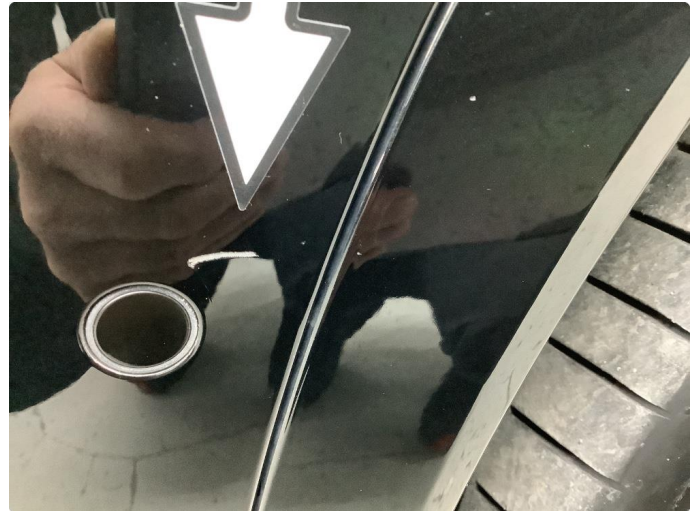
1.1 Ripe/lakk (halv del)