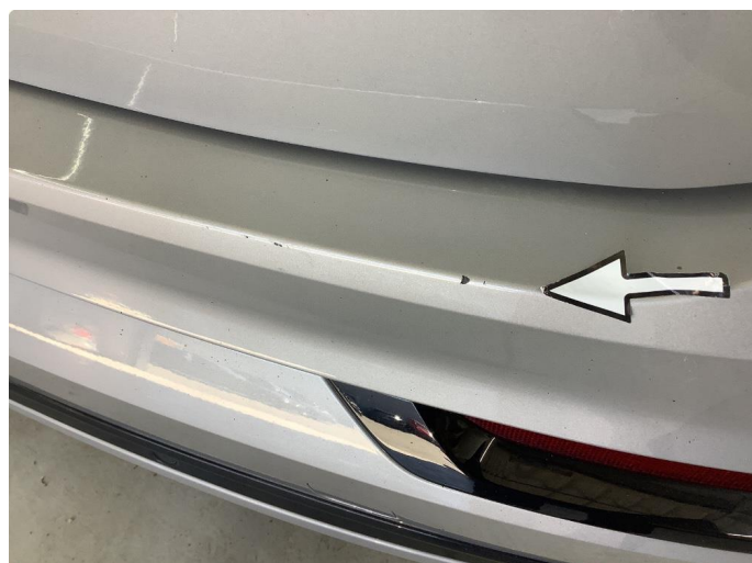
1.3 Skarpe kanter