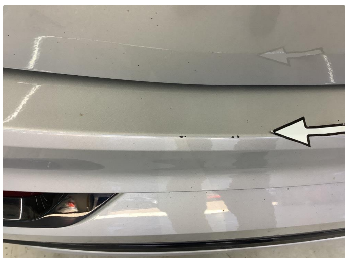
1.3 Skarpe kanter