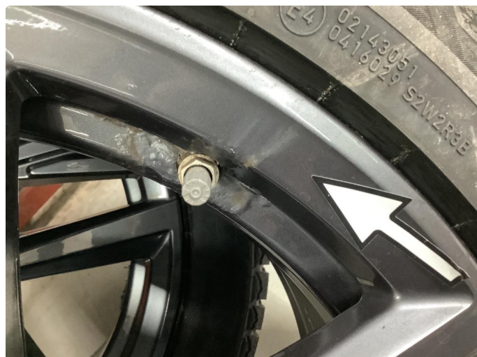
1.2 Påbegynnende oksidering