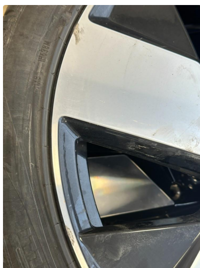
1.1 To kantkjørte sommerfelger