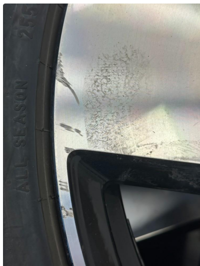
1.1 To kantkjørte sommerfelger