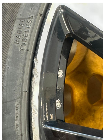
1.1 To kantkjørte sommerfelger