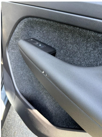
2.1 Liten rift i dørtrekk høyre side bak