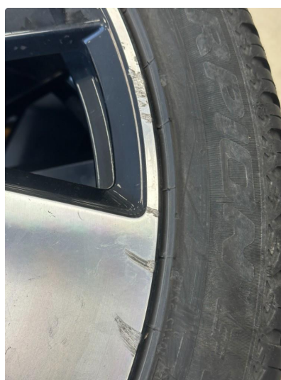
1.1 To kantkjørte sommerfelger