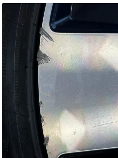
1.1 To kantkjørte sommerfelger