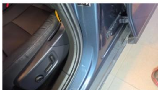
1.4 Liten bulk på innsteg venstre side foran