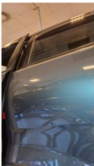
1.2 Svake riper på høyre og venstre bakkjør