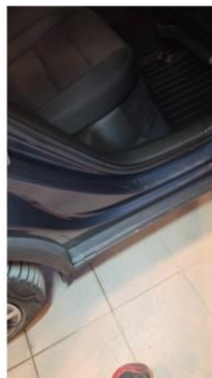
1.3 Ripe i innsteg høyre side bak