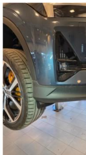
1.5 Liten steinsprut i lakk på støtfanger foran, flekkes