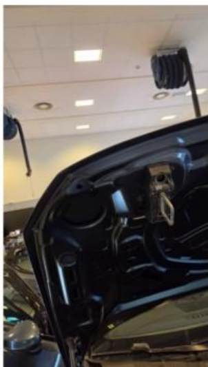
1.1 Noe slitasje i lakk under panser