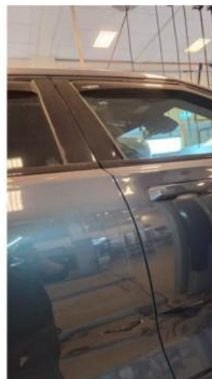
1.2 Svake riper på høyre og venstre bakkjør