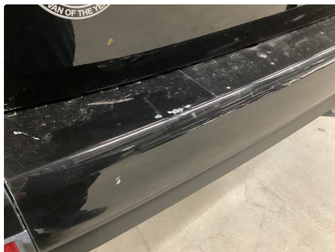
1.3 Slitt gjennom lakk