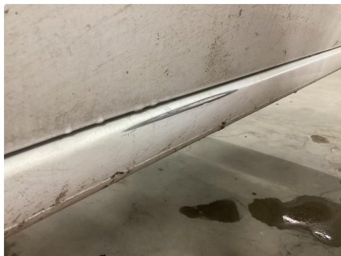
1.2 Slitt gjennom lakk