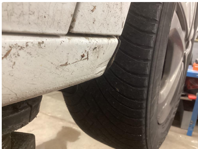
1.6 Bulk med lakkskade