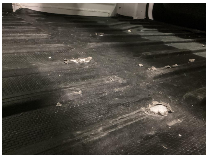
2.1 Kledning/gulv skadet