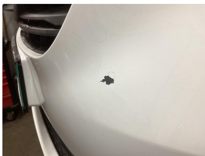
1.5 Lakk flasser