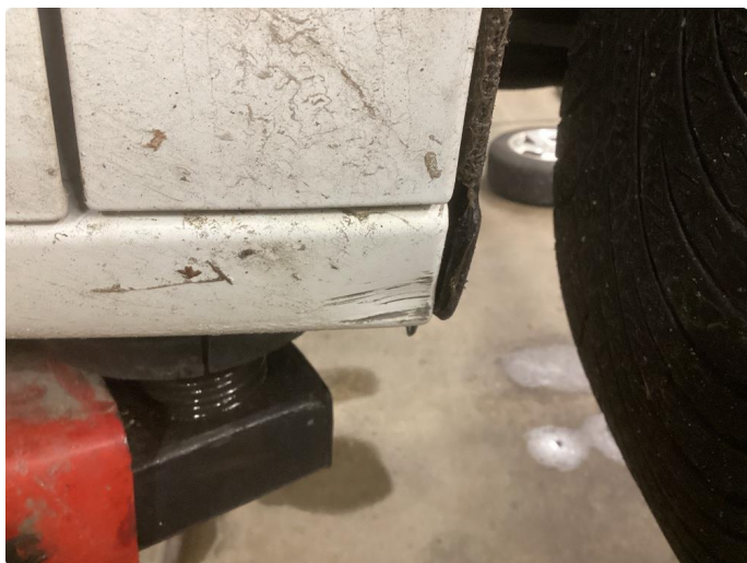
1.6 Bulk med lakkskade