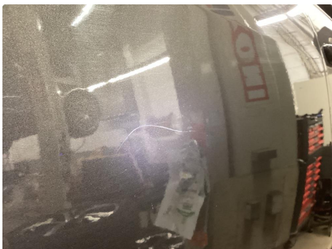
1.3 Riper (polert etter bildet)