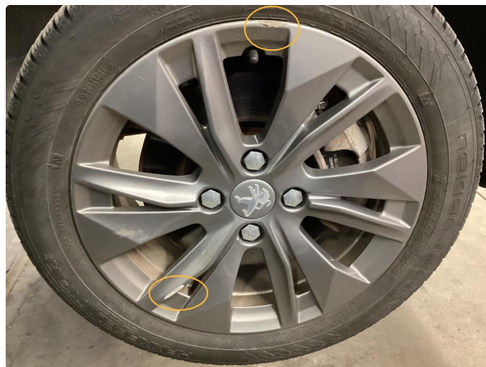
1.7 Kantkjørt felg