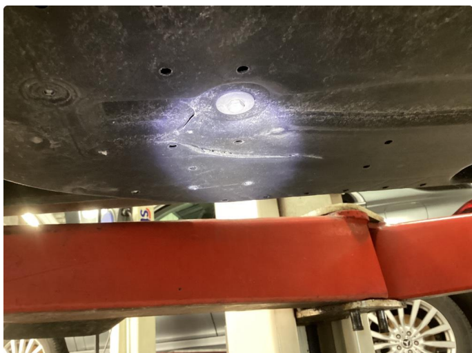
1.1 Beskyttelsesplate skadet