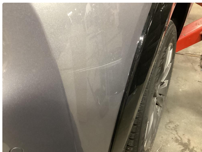
1.9 Ripe, polert etter bilde ble tatt