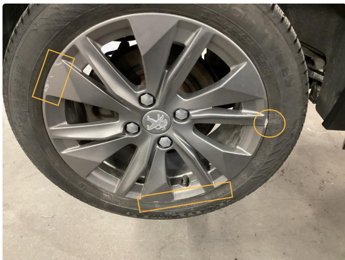
1.7 Kantkjørt felg