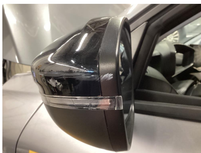
1.6 Speilhus riper