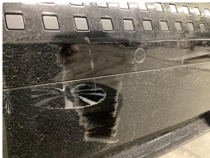
1.2 Ripe, polert etter bildet.