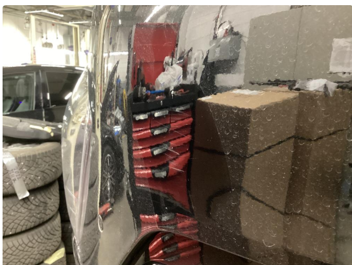
1.3 Ripe, polert etter bildet.