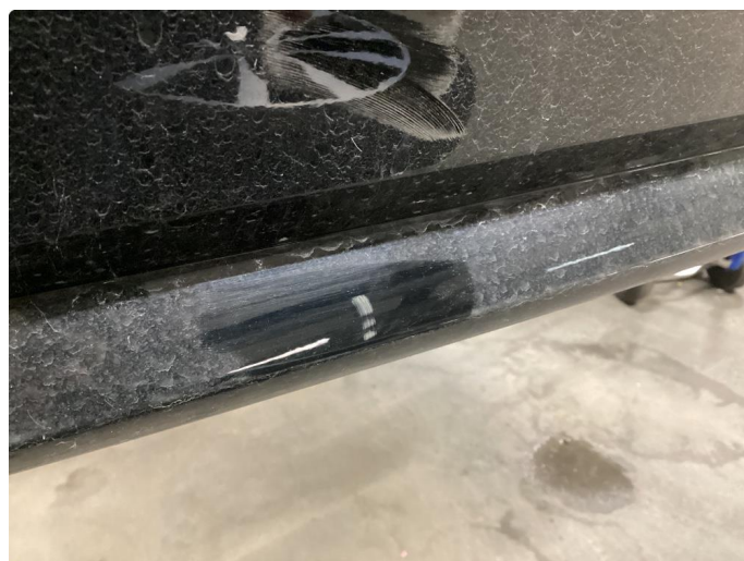
1.2 Ripe, polert etter bildet.