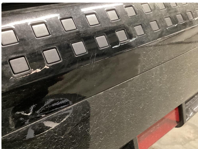
1.2 Ripe, polert etter bildet.