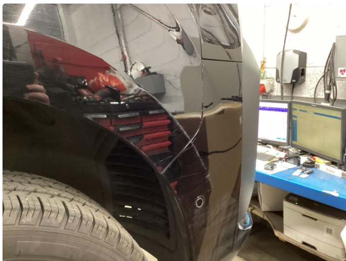
1.5 Riper (polert etter bildet)