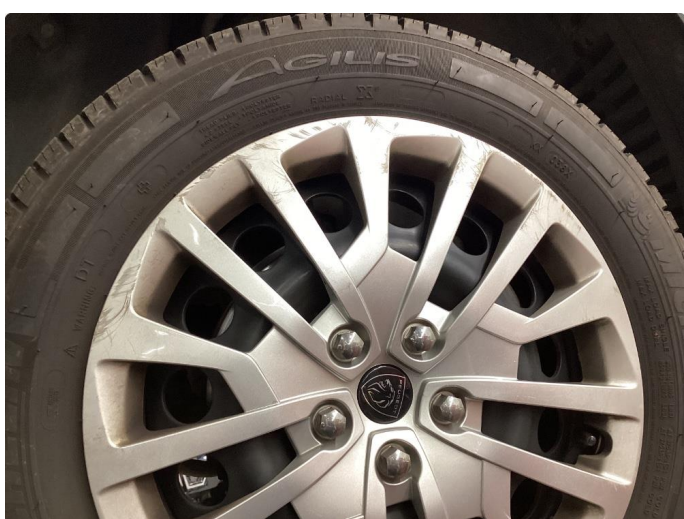
1.4 Riper hjulkapsel