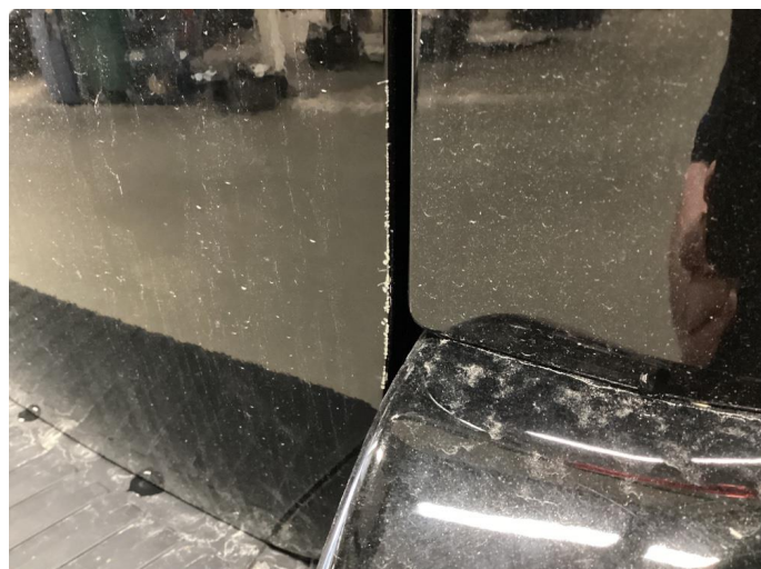
1.2 Riper (polert etter bildet)