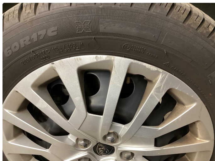
1.4 Riper hjulkapsel