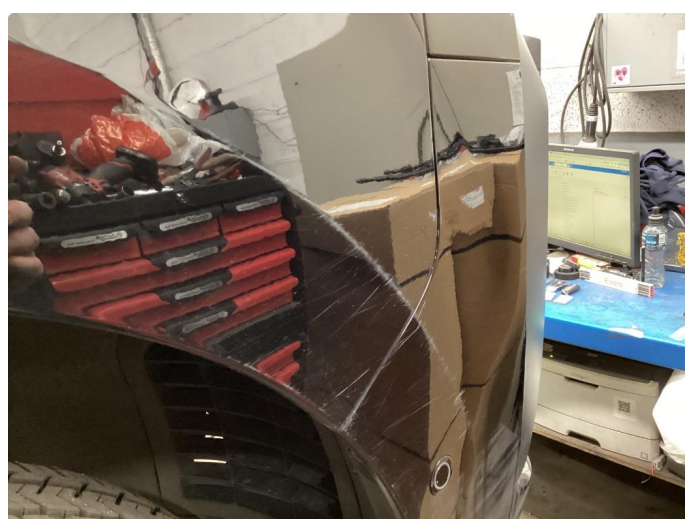
1.5 Riper (polert etter bildet)