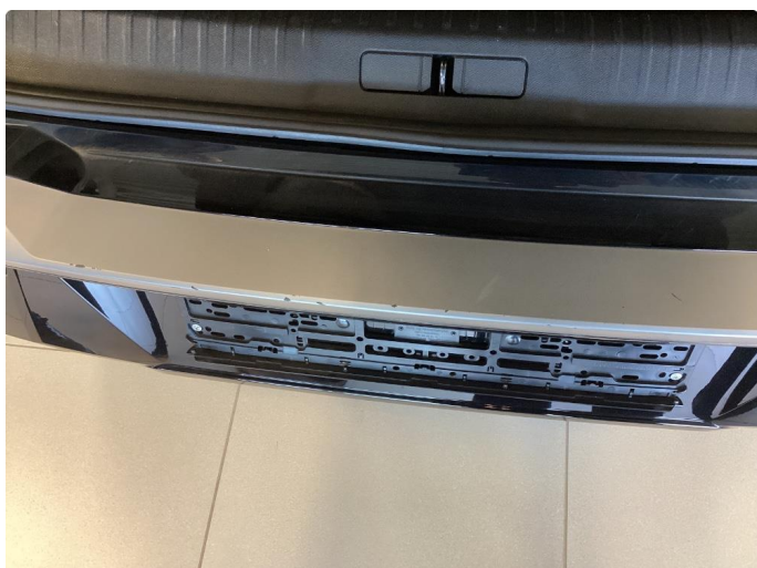
1.3 Slitt gjennom lakk