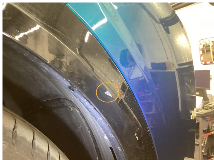
1.2 Ripe (polert etter bildet)