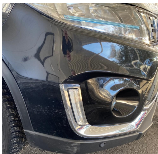
2.3 Kosmetiske merker foran h-side