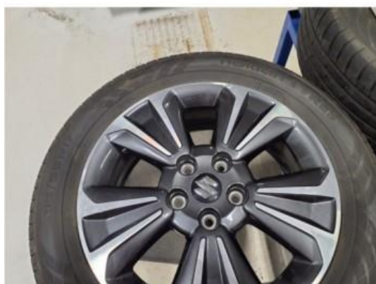
2.2 Felger har kosmetiske merker