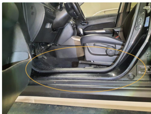
2.1 Døråpninger har kosmetiske merker