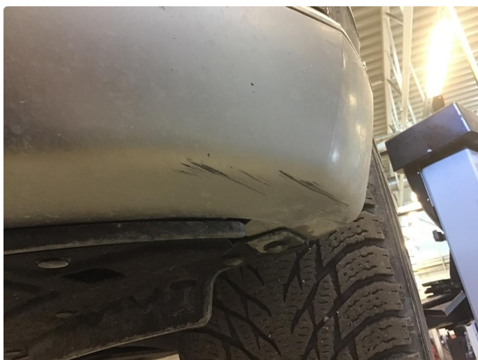
1.1 Normal bruksslitasje