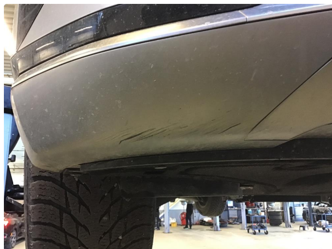
1.1 Normal bruksslitasje