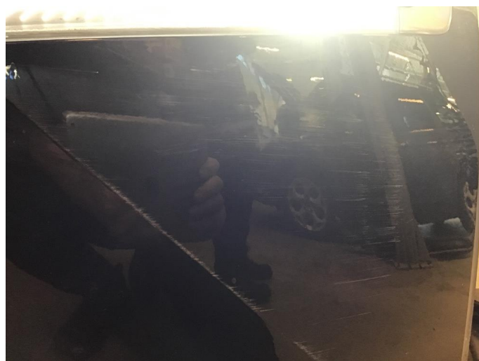
1.2 Normal bruksslitasje