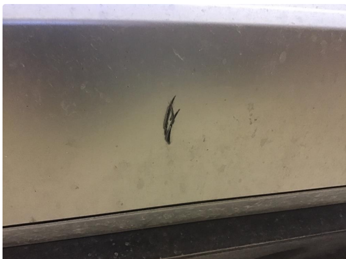
1.1 Normal bruksslitasje