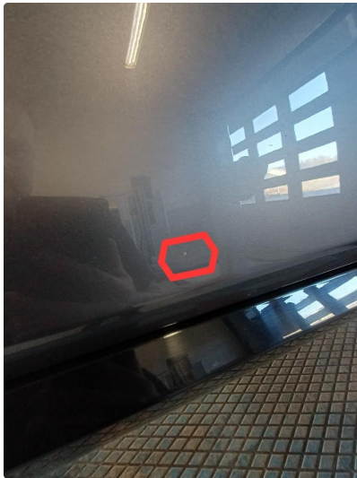
1.1 Normal bruksslitasje