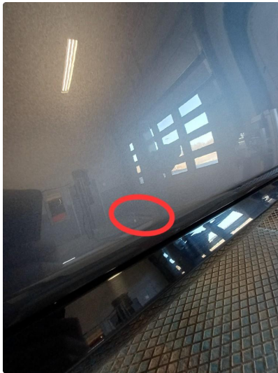
1.1 Normal bruksslitasje