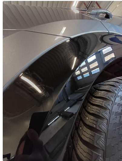
1.1 Normal bruksslitasje