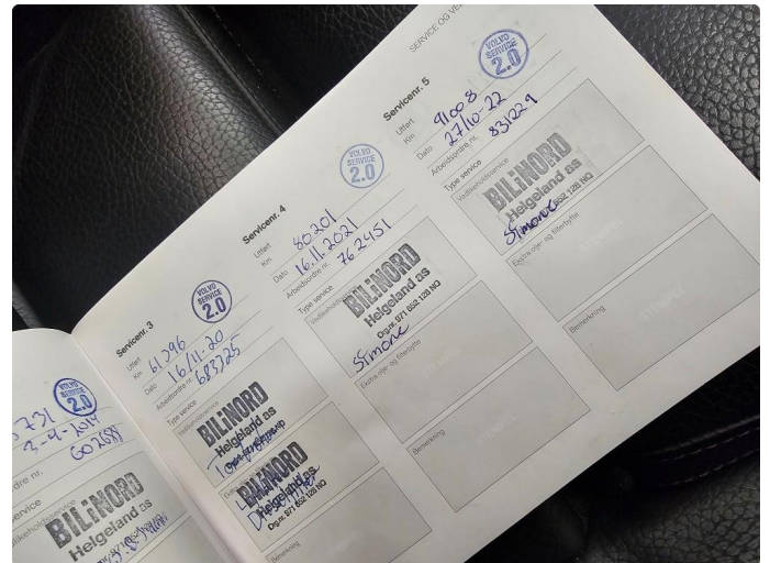
2.1 Dokumentert service, se bilde