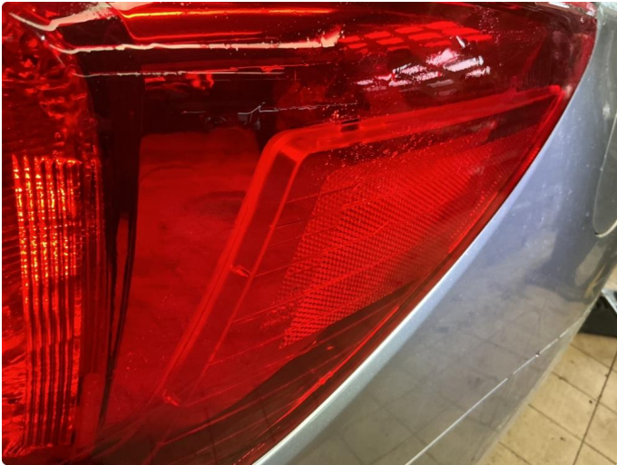
1.1 Krakelering i plast