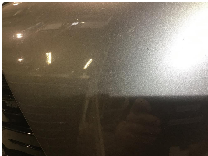
1.1 En del steinsprut - spesielt på høyre side