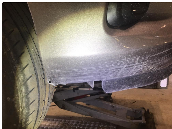
1.2 Riper på støtfanger