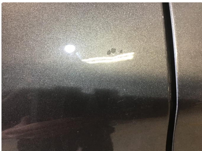
1.1 En del steinsprut - spesielt på høyre side