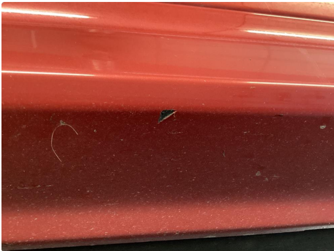
1.1 Lite "sår" pensles