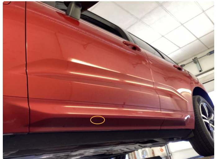
1.1 Lite "sår" pensles