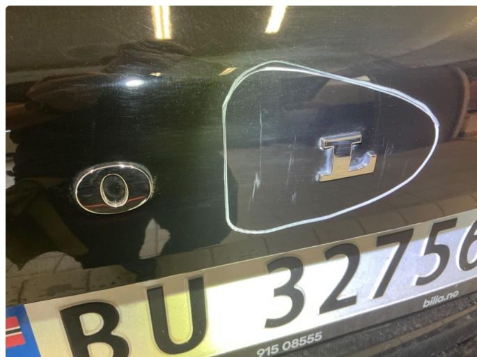
1.1 Ripe, forsøkes rubbes/poleres evt lakkeres hvis det trengs før levering