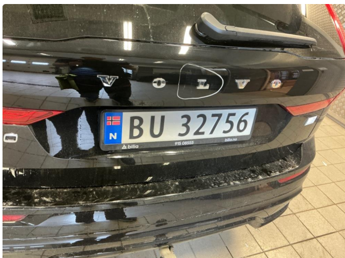
1.1 Ripe, forsøkes rubbes/poleres evt lakkeres hvis det trengs før levering