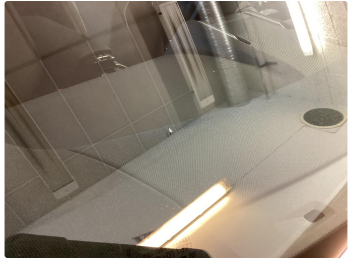
1.1 Liten steinsprut utenfor synsfelt som limes