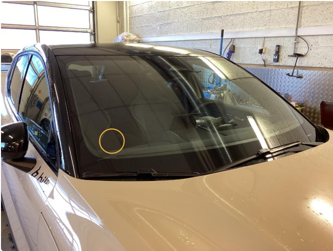
1.1 Liten steinsprut utenfor synsfelt som limes