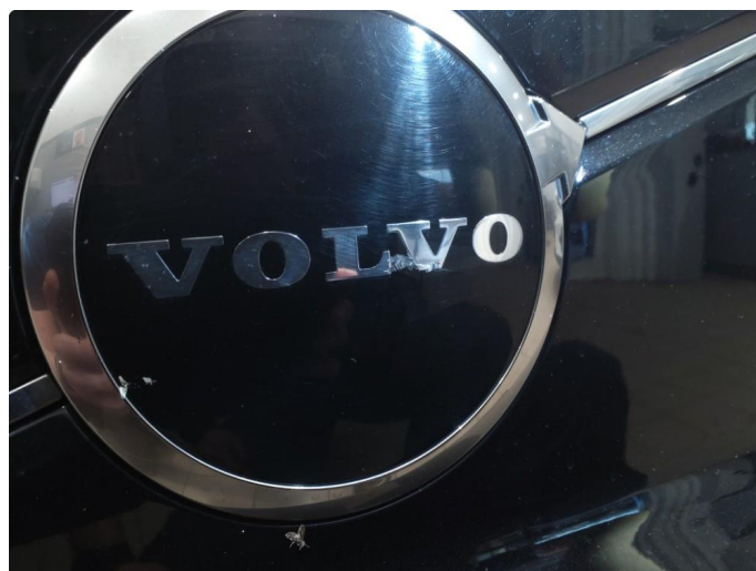
1.4 Merke emblem