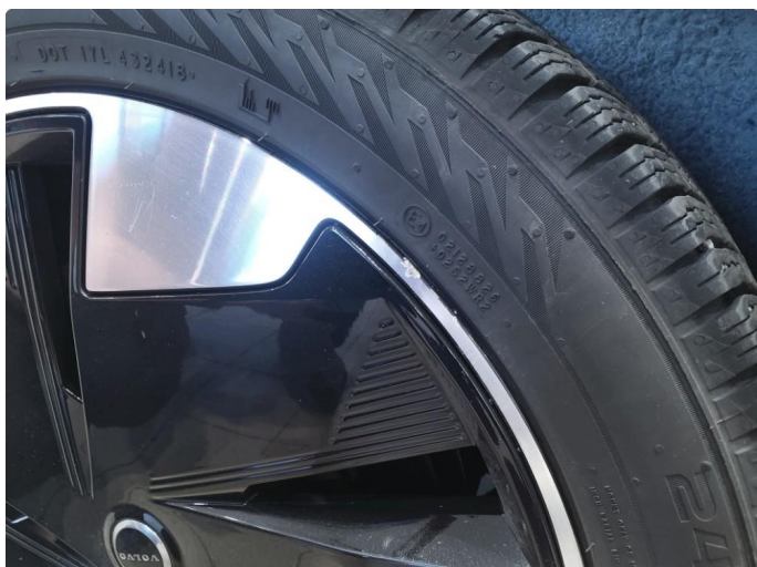
1.1 Merke felg Diamond Cut