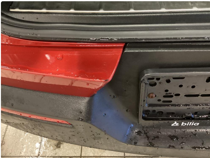
1.1 Ripe(r) bakfanger