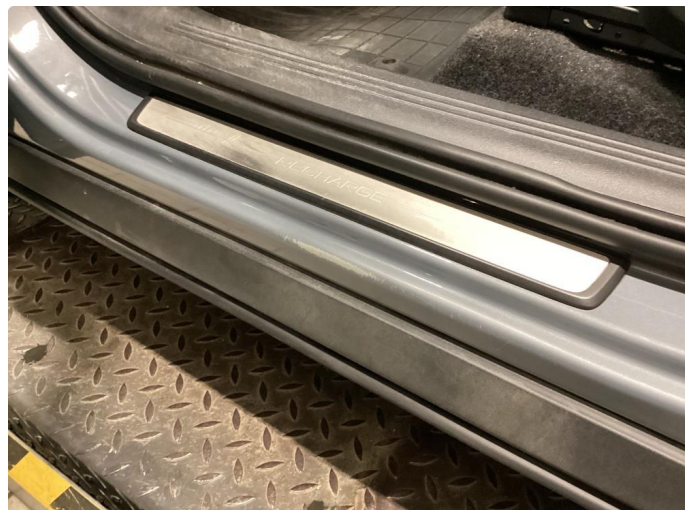
1.2 Slitt innsteg