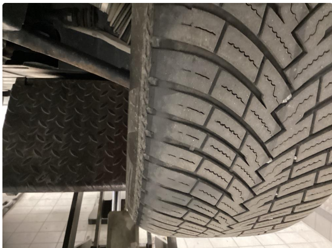
1.1 Skjev slitasje på sommerdekk