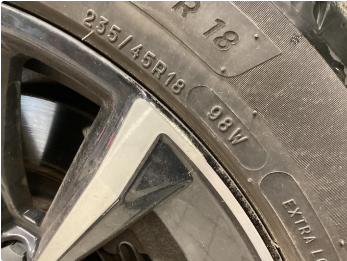
1.1 Merker i felg