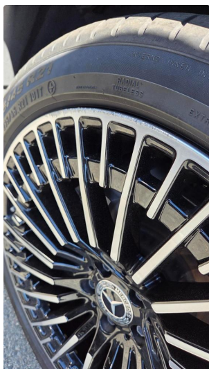
1.1 Sommerhjul - Kantkjørt på alle 4 felgene.