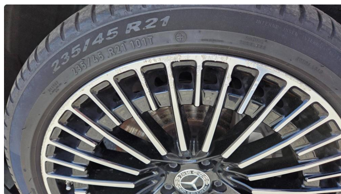
1.1 Sommerhjul - Kantkjørt på alle 4 felgene.