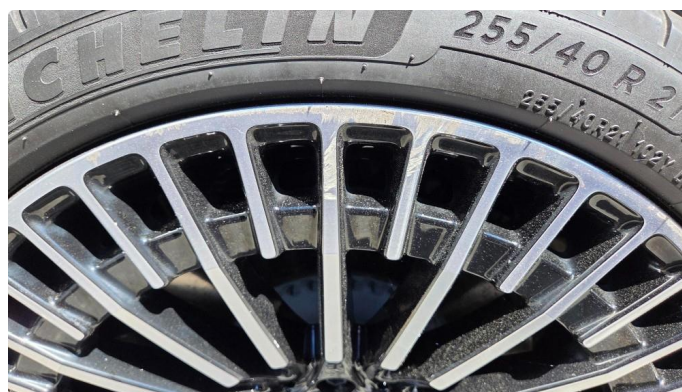
1.1 Sommerhjul - Kantkjørt på alle 4 felgene.