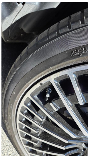
1.1 Sommerhjul - Kantkjørt på alle 4 felgene.