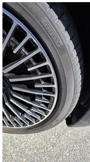
1.1 Sommerhjul - Kantkjørt på alle 4 felgene.