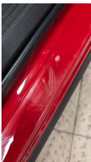
1.2 Normal slitasje iht alder og KM på innsteg