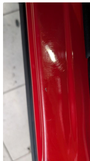
1.2 Normal slitasje iht alder og KM på innsteg