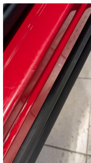
1.2 Normal slitasje iht alder og KM på innsteg