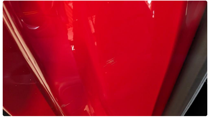
1.2 Normal slitasje iht alder og KM på innsteg