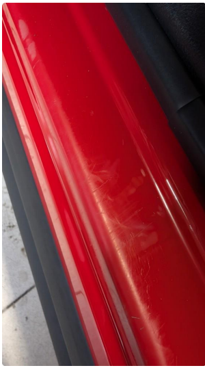
1.2 Normal slitasje iht alder og KM på innsteg