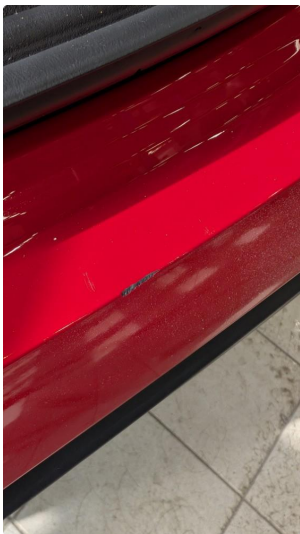
1.3 Liten ripe på støtfanger bak - normal iht alder og KM