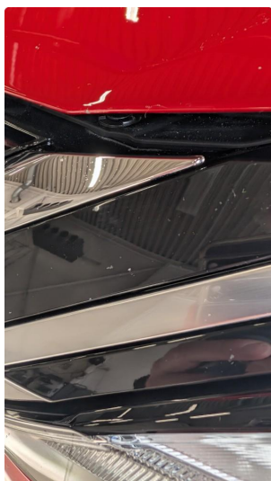
1.1 Noen få steinsprang - normal iht alder og km