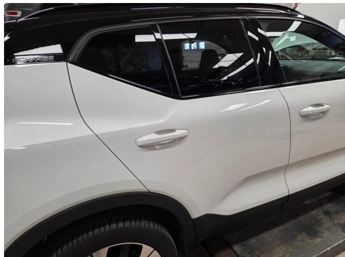
1.1 2 hakk i klarlakken på høyre side, flikkes .