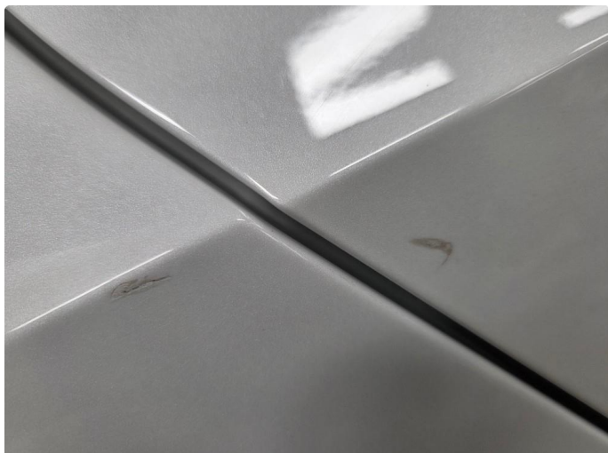
1.1 2 hakk i klarlakken på høyre side, flikkes .