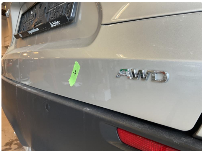
1.1 Liten bulk