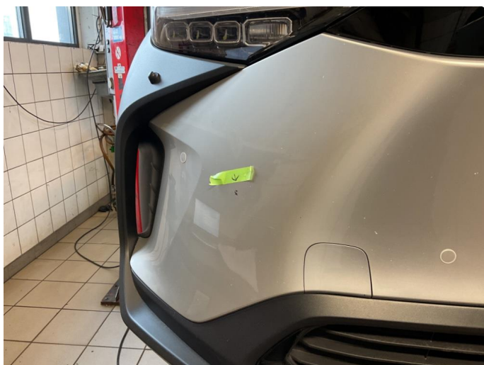
1.3 Ripe i fanger h side