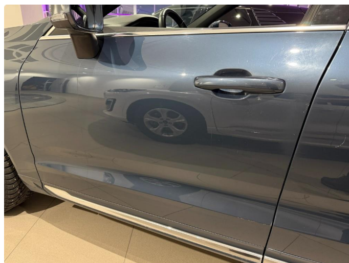
1.2 Bulk under speil førerdør.