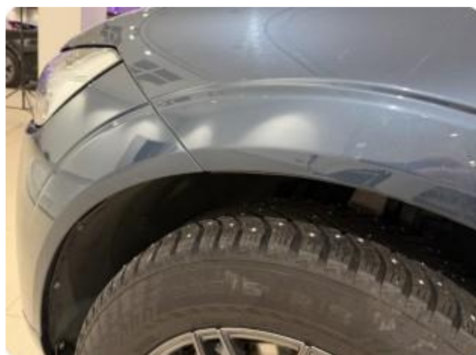
1.1 Normal bruksslitasje iht. alder og km stand.