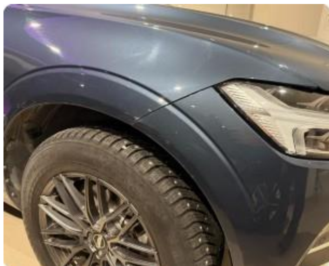
1.1 Normal bruksslitasje iht. alder og km stand.