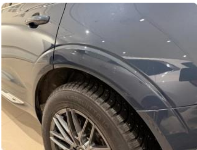
1.1 Normal bruksslitasje iht. alder og km stand.