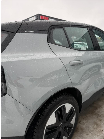
1.1 Minibulk bakskjerm høyre.