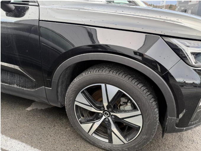
1.1 Bulk/ripe skjerm høyre foran.