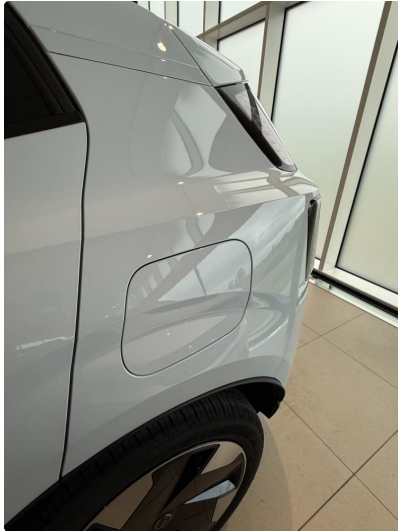
1.1 Minibulk over ladeluke skjerm venstre bak.